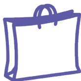
Litiges de la consommation