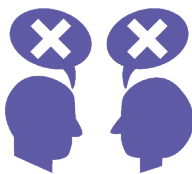
Litiges entre commerçants